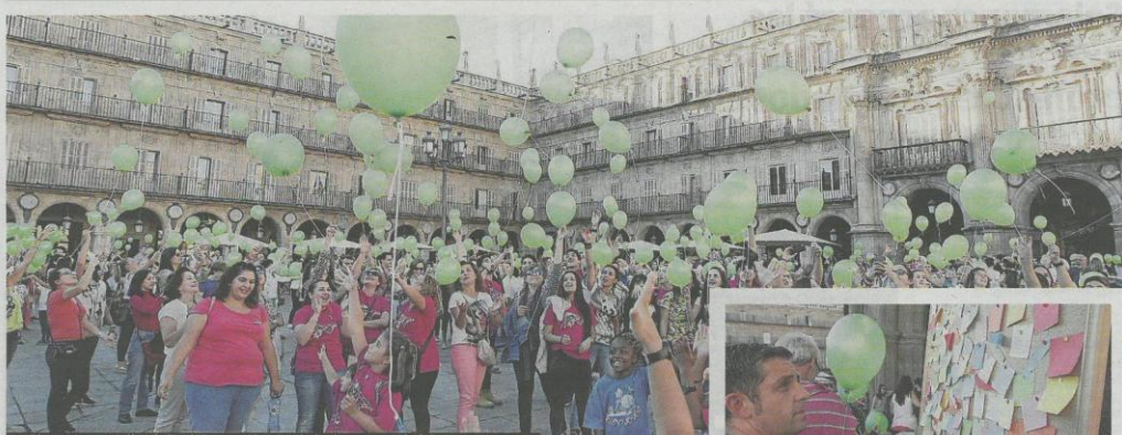
La Plaza Mayor se llenó de globos verdes por la lucha contra el alzheimer. // ALMEIDA