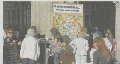
Panel de recuerdos ayer en la Plaza Mayor.

Uno de los principales objetivos de la jornada era sensibilizar a la sociedad española acerca de esta "epidemia del siglo XXI", así como sus consecuencias socio sanitarias, mientras que tampoco hay que olvidar el de conseguir socios. Necesitan personas solidarias, que se comprometan con la enfermedad. Por eso su lema de cara a este día mundial seguirá siendo: "Hazte socio, uno más cuenta". Alzheimer, persona non grata en Salamanca.