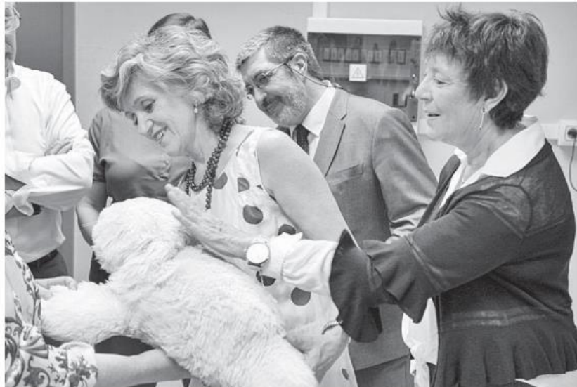
La ministra de Sanidad en funciones (izquierda) visita el Centro de Atención a Personas con Alzheimer.

Durante su intervención en Salamanca también hizo un reconocimiento al “impulso de las comunidades sobre sus presupuestos”. Pero lamentó de nuevo que desde la Administración del Estado “solo se puedan gestionar esos presupuestos” que como remarcó “alcanzan lo que alcanzan”.