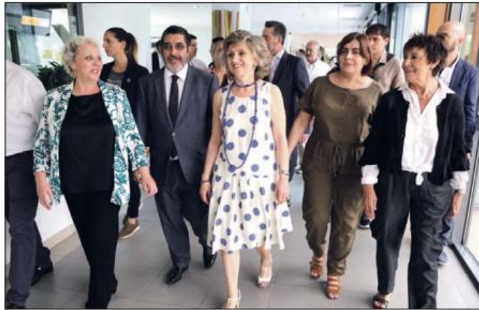
María Luisa Carcedo, en su visita al Centro de Referencia Estatal de Atención a Personas con Enfermedad de Alzheimer.

ENTORNO DEL ENFERMO En tercer lugar, Carcedo se refirió a la necesidad de avanzar en el conocimiento de la enfermedad y en sus posibles tratamientos mientras que en cuarto lugar la ministra defendió la necesidad de que quienes padecen esta demencia "puedan seguir vinculados" a su entorno, para lo que es