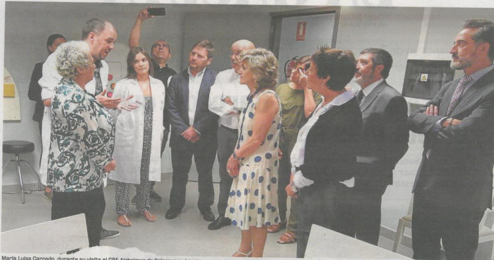
María Luisa Carcedo, durante su visita al CRE Alzheimer de Salamanca.