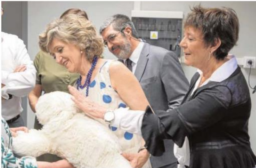
La ministra de Sanidad, el gerente de Sacyl y la delegada del Gobierno, ayer en el CRE del Alzheimer